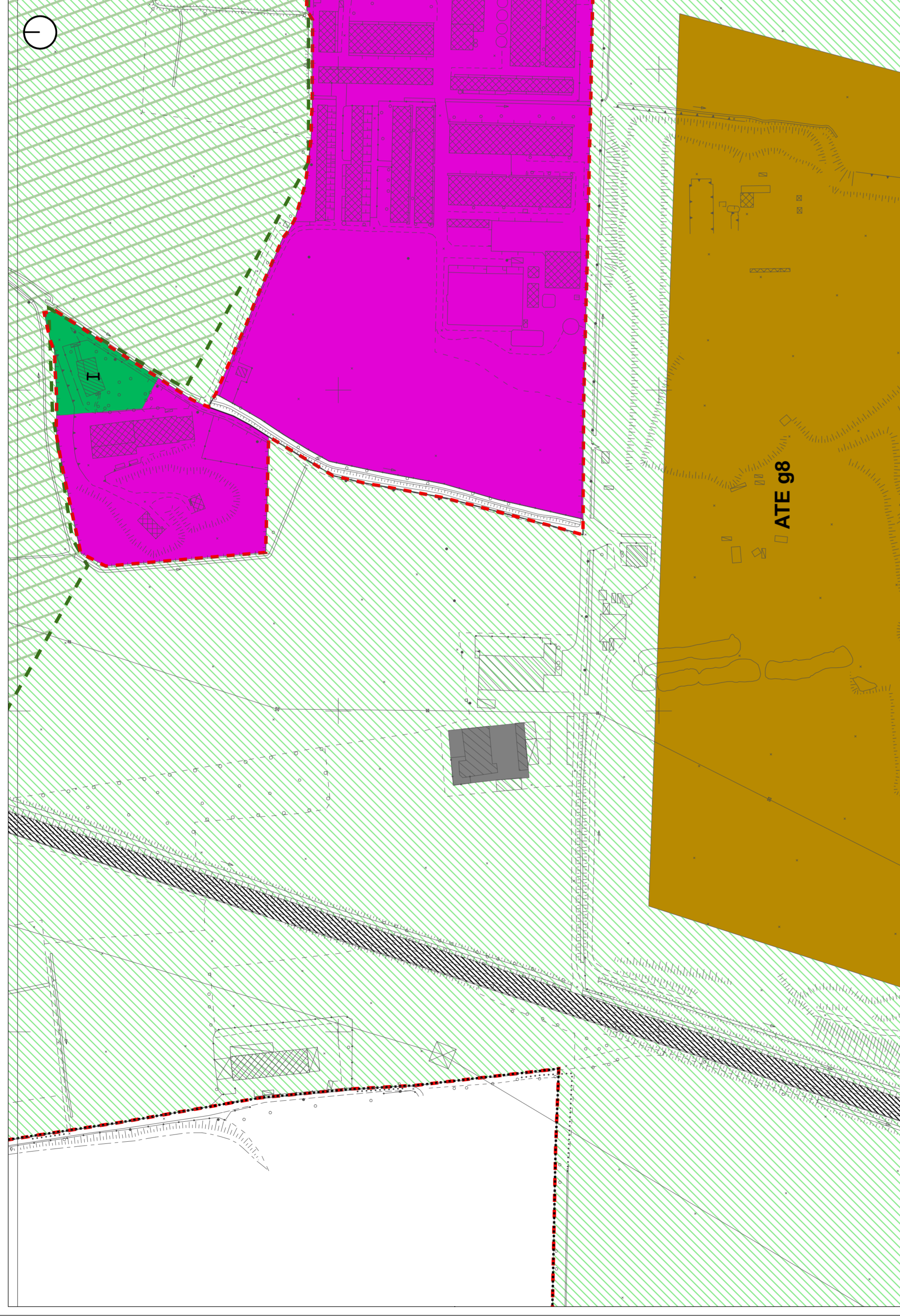
PGT vigente - estratto tavola P1.a: aggregato urbano di origine moderna